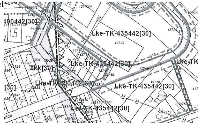
Lépték nélküli szabályozási terolap-kivonat (SZÉSZ 34-2)

A tervezésnél az Országos Településrendezési és Építési Követelményekről szóló 253/1997. (XII. 20.) Kormányrendelet (továbbiakban: OTÉK) 31. §, 32. § és 39. §-ában foglalt követelményeknek meg kell felelni.